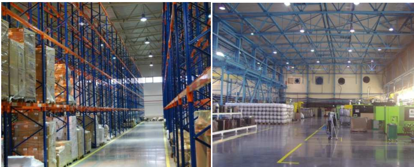
Рис. 3. Светильники GALAD Гермес ГСП51 на складах Лихославльского светотехнического завода.

положения, благодаря чему один и тот же светильник обладает четырьмя вариантами КСС и может использоваться в самых разных типах помещений. (Рис. 3 и 4).