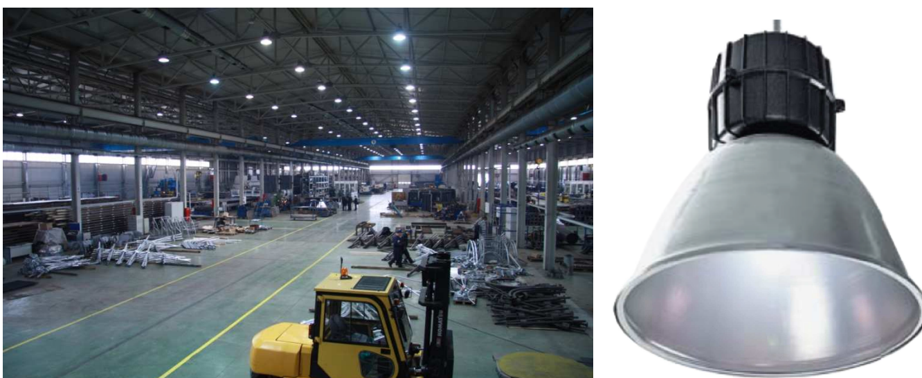
Рис. 4. Светильники GALAD Гермес ГСП51 на складах Тульского завода по производству металлоконструкций Opora Engineering.

Ещё одним преимуществом этого промышленного светильника является его универсальный узел крепления. Светильник одинаково легко можно крепить на трос, брус, крюк, трубу или монтажный профиль, что упрощает его монтаж и расширяет возможности применения. (Рис. 5).