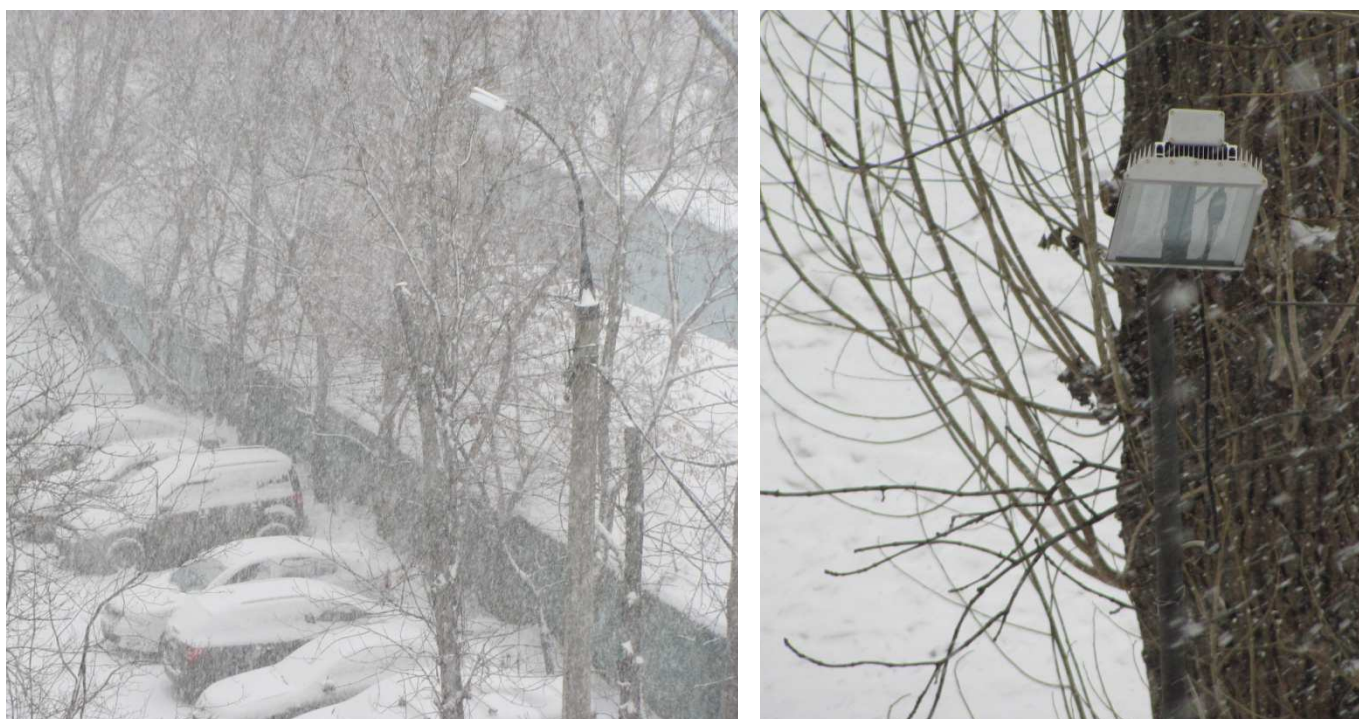
Рис. 1. Светодиодные светильники зимой.

В России, как в очень большой стране, присутствуют самые разные климатические зоны. И хотя большая часть территорий находится в умеренном поясе, значительную площадь занимают регионы с холодным климатом. Самые жёсткие условия для жизни в Заполярье, Восточной Сибири и на Дальнем Востоке. Температура здесь в зимнее время года может опускаться ниже -50^{\circ}\text{C} , регулярно выпадает снег, обледеневают дороги. При этом зимой продолжительность светового дня очень короткая и улицы городов особенно нуждаются в качественном и эффективном освещении.