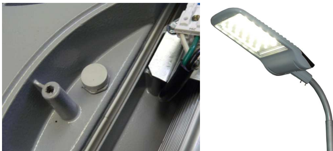
Рис. 2. Фото антиконденсационного клапана в светильнике GALAD Волна 2 ДКУ04.

В процессе работы светильника светодиоды и источник питания выделяют значительное количество тепла, которое рассеивается в окружающую среду корпусом светильника. Большая разница температур с внешней средой приводит к тому, что внутри корпуса образуется конденсат. Если конструкция не предусматривает отвода влаги, она остаётся заключённой во внутреннем объёме и может стать причиной некорректной работы или выхода из строя светильника. Таким образом, высокая герметичность конструкции светильника может сыграть отрицательную роль. Наоборот, светильники с отверстиями в корпусе для отвода водяных паров или конденсата на холоде работают надёжнее.